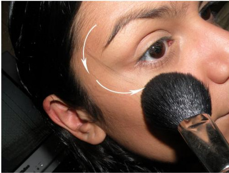
Aplico no topo das maçãs do rosto e também nas têmporas, fazendo um formato de "C".