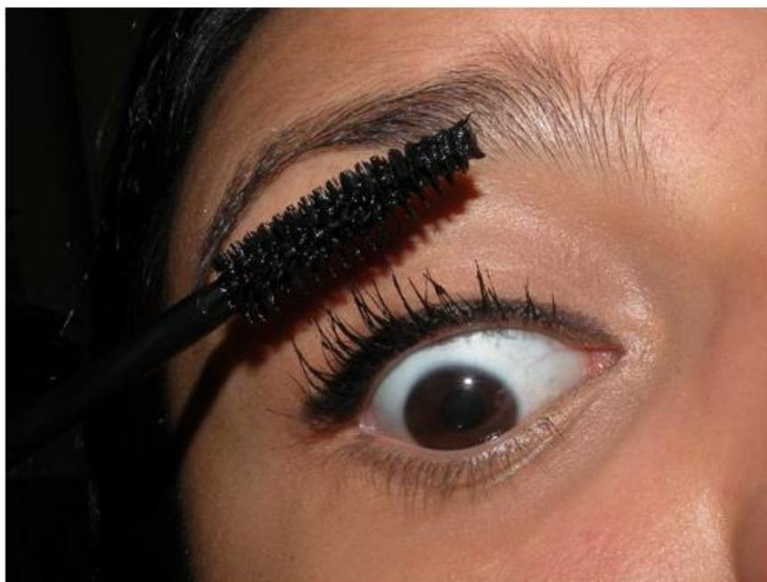
Passo uma segunda camada, dessa vez com o Diorshow Black Out (que é meio ruim), para dar um ar bem preto aos cílios.