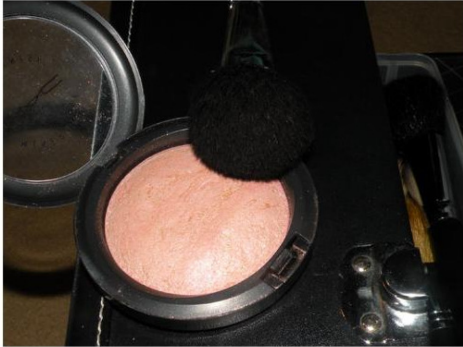
Utilizo o Mineralize Skinfinish Porcelain Pink (MAC) como iluminador.