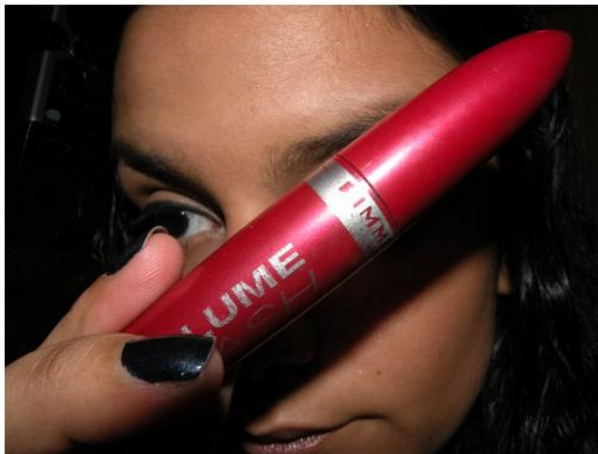
Passo uma primeira camada de rímel, utilizando o Volume Flash (Rimmel London).