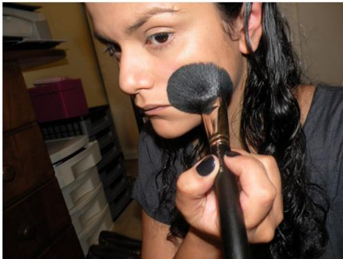
Aplico pó (Studio Fix NC40, MAC) para "assentar" a base e o corretivo.