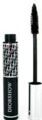
Muito rímel DiorShow na parte de cima e de baixo.