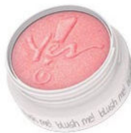
Blush Yes! Cosmetics cor Peach Cheek passado beem de leve, só para dar um ar saúde.