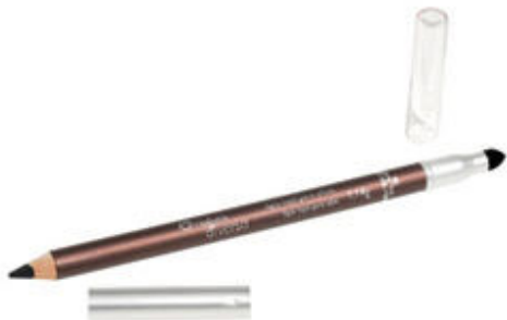
Lápis Kajal Natura para delinear a parte de cima do olho.